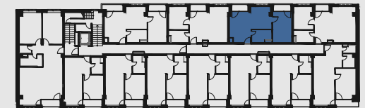
s c h é m a p ô d o r y s u 3 . N P / s c h e m e o f t h e t h i r d f l o o r