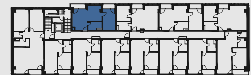
s c h é m a p ô d o r y s u 3 . N P / s c h e m e o f t h e t h i r d f l o o r