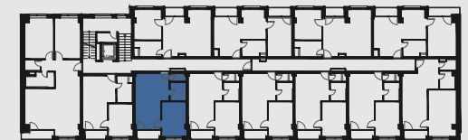
s c h é m a p ô d o r y s u 2 . N P / s c h e m e o f t h e s e c o n d f l o o r