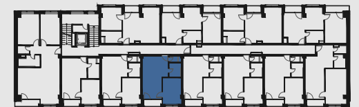
s c h é m a p ô d o r y s u 2 . N P / s c h e m e o f t h e s e c o n d f l o o r