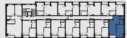
s c h é m a p ô d o r y s u 2 . N P / s c h e m e o f t h e s e c o n d f l o o r