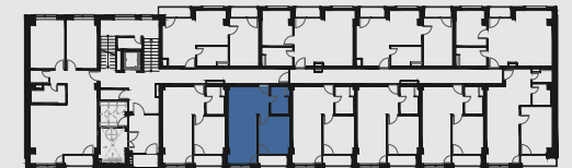
s c h é m a p ô d o r y s u 1 . N P / s c h e m e o f t h e f i r s t f l o o r