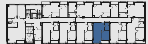
s c h é m a p ô d o r y s u 1 . N P / s c h e m e o f t h e f i r s t f l o o r