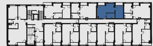
s c h é m a p ô d o r y s u 1 . N P / s c h e m e o f t h e f i r s t f l o o r