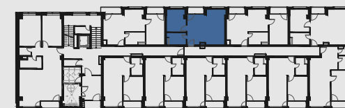
s c h é m a p ô d o r y s u 1 . N P / s c h e m e o f t h e f i r s t f l o o r